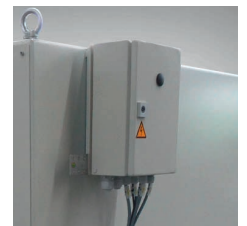
Klemmen-/Schaltkasten Terminal-/switch box