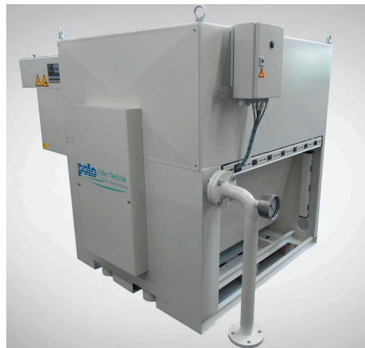
Trommelausführung / Drum design