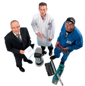
Fragen Sie uns! Please contact us!