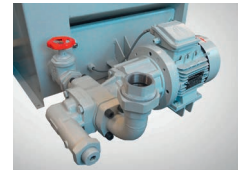
Filterabförderpumpe Filter evacuation pump