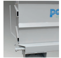
Leichte Bedienung Easy handling