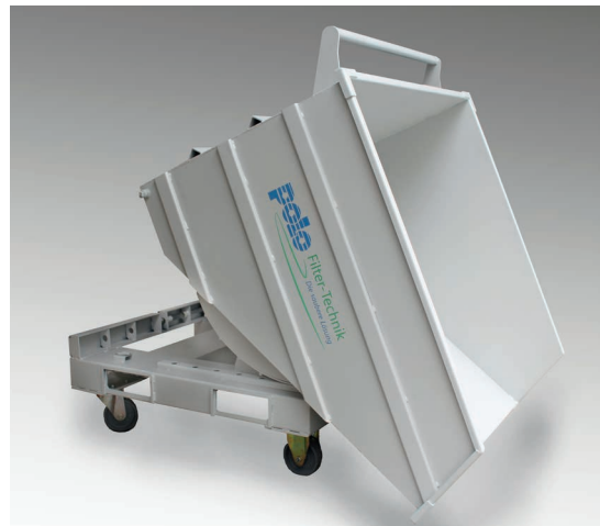
Kippbar / Tilttable

The chip carriage can be operated quickly and easily, which is why it can be used very flexibly. Today on machine A and tomorrow on machine B – no problem with our chip cart, as it is equipped with castors. For longer distances, it can also be transported by forklift truck.