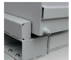
Tornillo de purga del aceite Oil drain screw