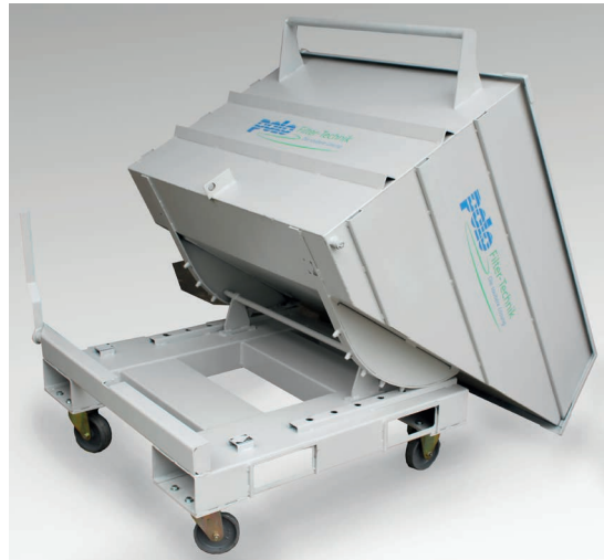
Perfiles de elevación / Lifting profiles

The liquid medium that collects in the chip carriage can be drained easily and quickly by means of the drain valve which is located on the rear bottom side. A protective grid holds back the chips so that the chip trolley is easier to empty later.