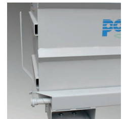
Fácil manejo Easy handling