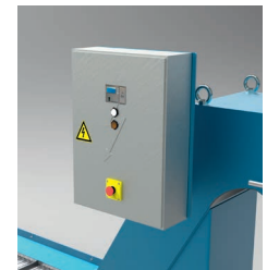
Control eléctrico Electrical control