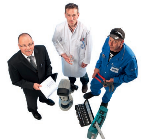
¡Consúltenos! Please contact us!

https://polo-filter.com/es/cinta-transportadora-con-bisagras-sbf/