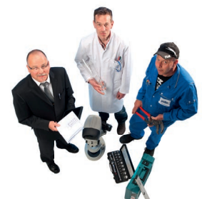
¡Consúltenos! Please contact us!

Las fotos muestran parcialmente el equipamiento adicional. Some of the photos show additional equipment.