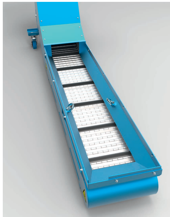
Colector de virutas / Chip collection

Reliable removal of chips from the machine by the slat band conveyor. Suitable for tufted chips, long steel chips and chip balls from dry and wet machining. Can be integrated into almost all types of machines. Available with and without tank. The length is variable and can be adjusted.