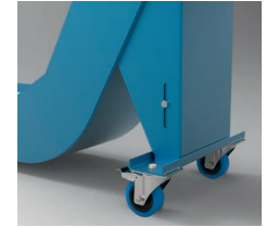
Ajustable en altura Height adjustable